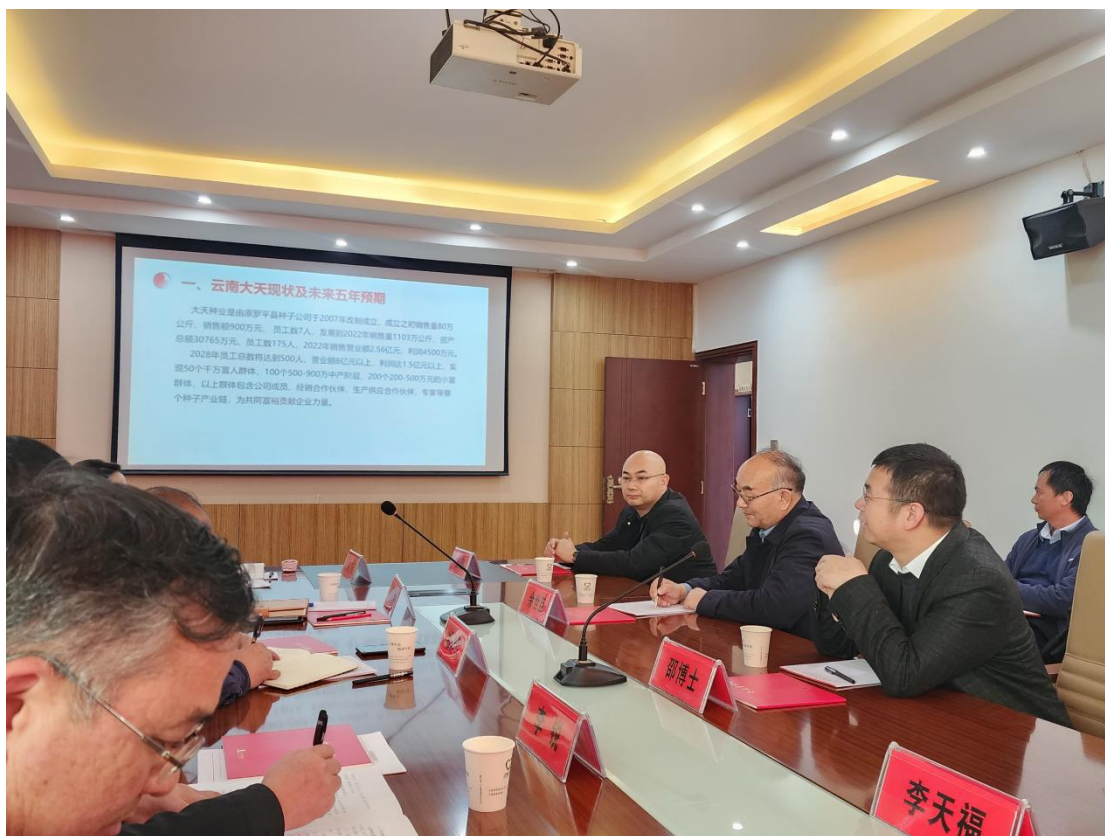
（图四：邵博士在座谈会上作工作指示）

此次邵博士视察指导工作，助推了大天种业的发展，大天种业会积极投身于建设农业强国的大农业新时代，聚合优势资源、协同发展，聚焦育种突破、创新平台。紧跟集团步伐，牢牢把握国家种业振兴战略，加快种业科技创新，为打赢种业翻身仗做出更大贡献。