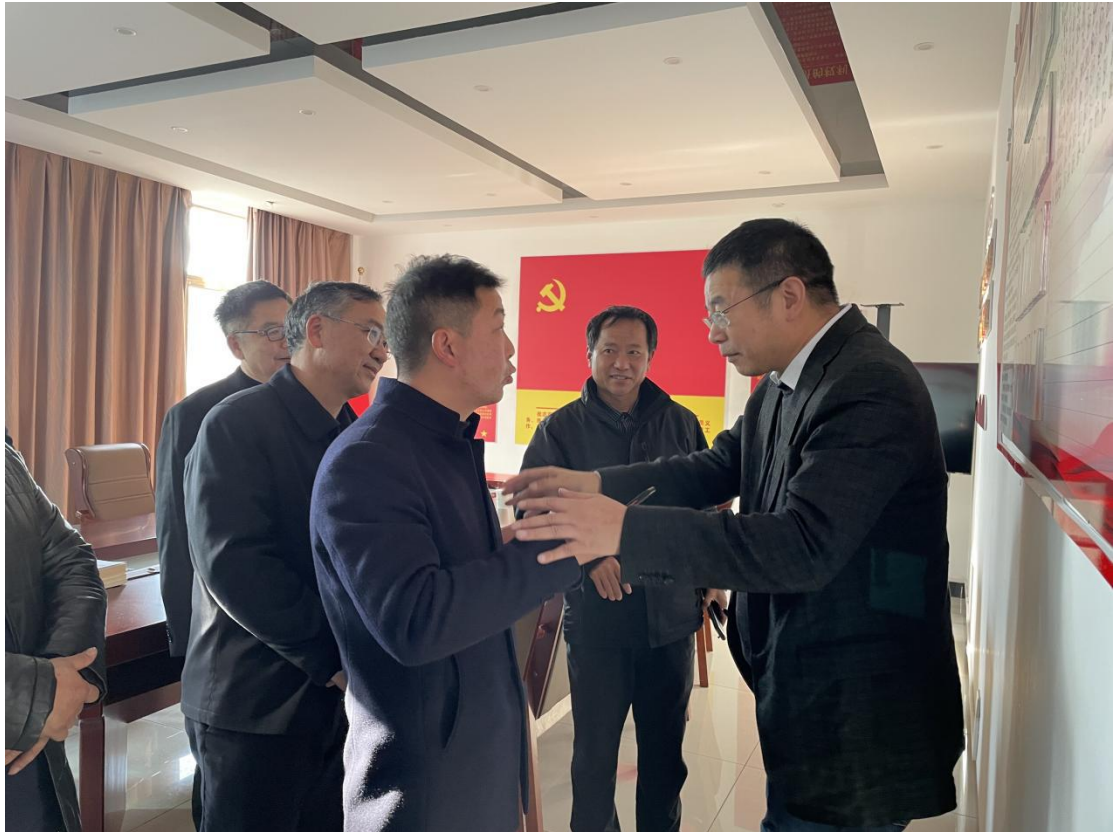
（图二：邵博士与市、县政府领导在大天种业党员活动室交流）

座谈会上，大天种业董事长详细介绍了大天种业现状、2022年经营完成情况、未来预期、发展展望及诉求等方面情况。邵博士对公司发展规划给予了高度赞扬，同时对公司的诉求表示同意。座谈会上曲靖市、罗平县、施甸县参会代表积极发言，纷纷希望大北农集团到本地开展制种基地建设，并将给予政策支持与配合。